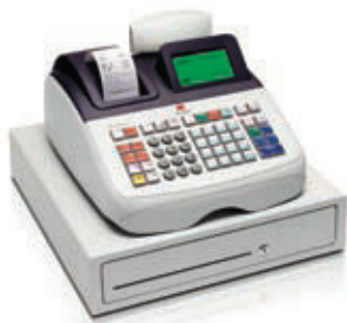
ECR 8200 sv