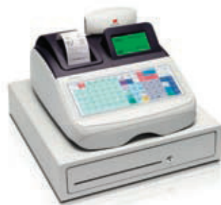
ECR 8220 sv