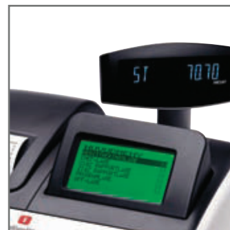
STOR GRAFISK OPERATÖRS DISPLAY