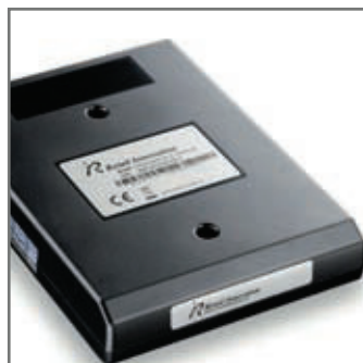
CLEAN CASH UNIT för den nya kontanthanteringslagen.