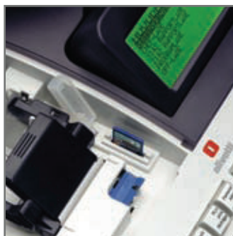
Plats för SD Minneskort