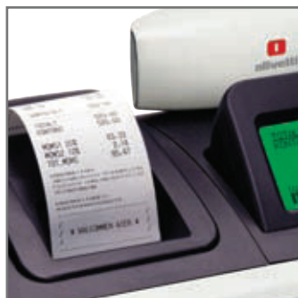
EXEMPEL PÅ KVITTO

ECR 8200 sv och 8220 sv klarar alla lagkrav som kommer att ställas från och med 1/1-2010. Kassaregistret skall anslutas till Retail Innovations Clean Cash kontrollenhet med certifikatnummer CU1001 för att bli ett certifierat kassaregister som följer lagen och ger dig och alla andra företagare möjlighet att konkurrera på lika villkor.